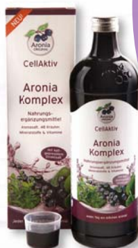
Vitalstoff-Cocktail. 700 Milliliter »Aronia Komplex« reichen für 35 Tage. Alkoholfrei und ohne Zusatz von Kristallzucker.